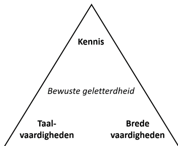
Figuur 1 Integratie in het schoolvak Nederlands

Cruciaal voor de drie onderwijsfuncties zijn bij Nederlands dus het verwerven van kennis over de Nederlandse taal en cultuur , het verwerven van taalvaardigheden en het verwerven van brede vaardigheden . Uiteraard kan de verwerving ervan apart of als een combinatie van een tweetal nagestreefd worden, maar integratie van alle drie biedt meerwaarde. Als het onderwijs alleen gericht is op vergroting van taal- en brede vaardigheden, zonder verbinding met kennis over de Nederlandse taal, literatuur en communicatie, dan verworden die vaardigheden tot lege procedures, zoals het toepassen van ezelsbruggetjes om taalfouten te vermijden, of het impressionistisch reflecteren op leeservaringen.